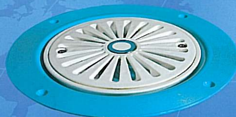
Bonde de vidage à pompe PGTF

Cet anneau adaptateur permet d'installer une bonde de vidage à siphon typique avec dégagement par le haut (bonde de vidage par gravité 50 mm standard) dans un Tuff-Form. L'adaptateur pour bonde de vidage apporte deux avantages : il est idéal lorsque l'espace sous le sol est limité et il facilite le raccord sur le tuyau d'évacuation par le dessus. L'adaptateur US est conçu pour des bondes de vidage US 50 mm standard.