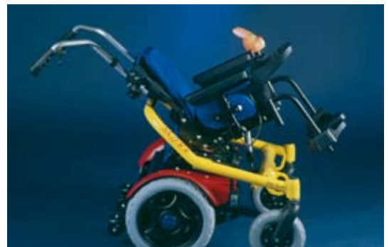
Bascule d'assise électrique