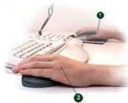
1 - votre souris classique pour déplacer le curseur 2 - l'Ergoclick pour cliquer