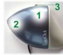
1 - Cliquer par une simple pression 2/3 - Fonction double clic mais vous ne devez cliquer qu'une seule fois

C'est avec l'ergoclick que vous cliquerez, et avec la paume de la main. Le double clic s'effectue lui grâce à un bouton très ingénieux placé sur le côté gauche de l'Ergoclick.