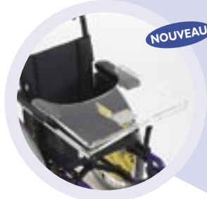
Tablette transparente (relevable sur la version Evolutif)