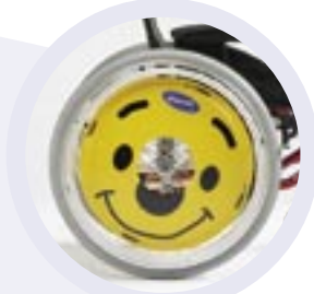
Protège-rayons Disponible uniquement Sur les roues 22"