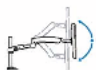
Ajustement rotationnel 330°