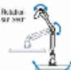
Pivotement à 180°