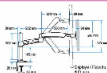
Deploy / Rétracté: 615 mm