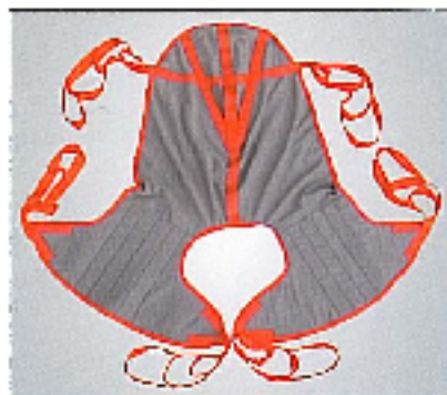
Sangle post-opératoire de pose de prothèse-amputation - Réf. 961.93.601 M

Les sangles post-opératoires pour patient amputé sont utilisées dans le cadre d'amputation longue ou courte d'un membre inférieur.