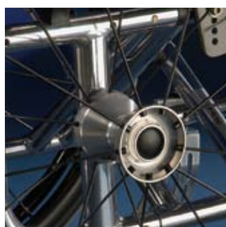
Position de roues arrières soudées