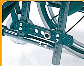
B113 Platine de réglage