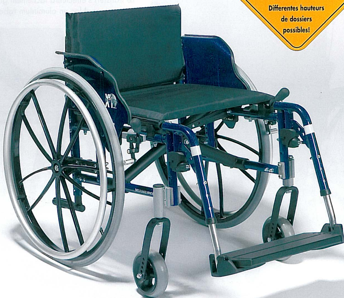
(modèle présenté avec options BK6, dossier 30 cm, roues Spider pneu 1 1/8)

Differentes hauteurs de dossiers possibles!