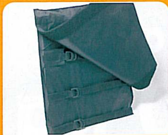
L44 - Dossier réglable en tension